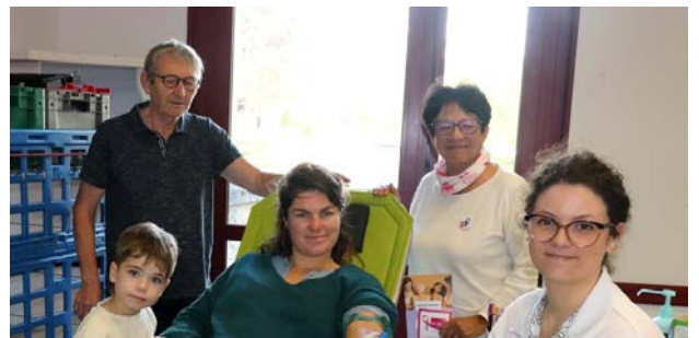
Don de sang en famille